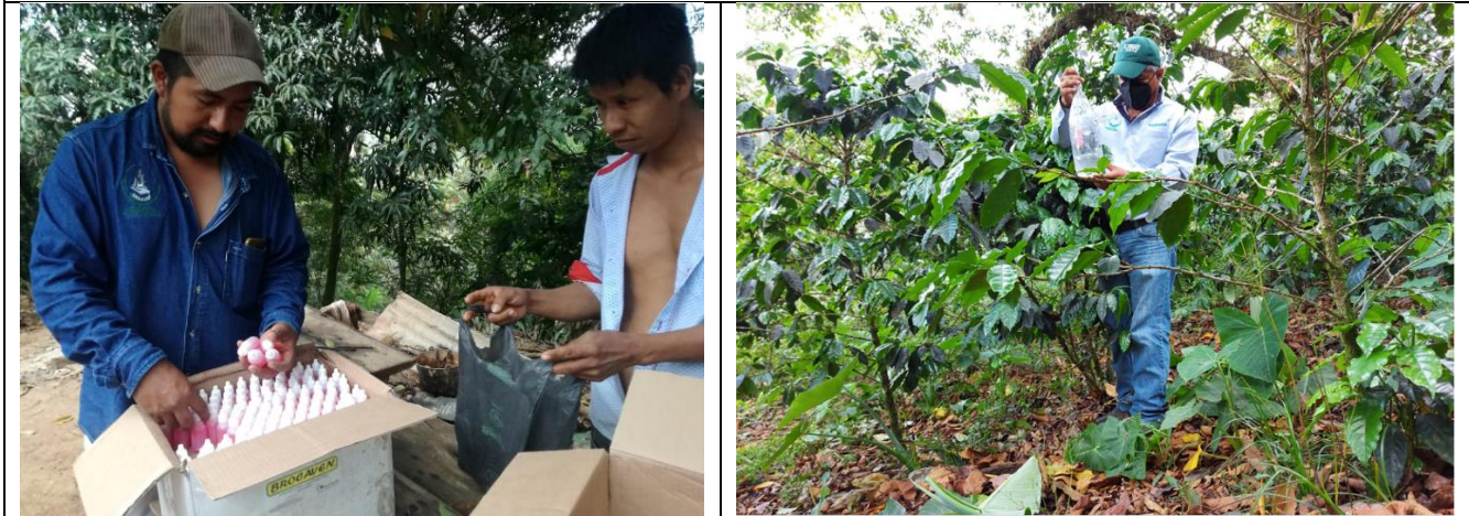
Trampeo de Broca del café.