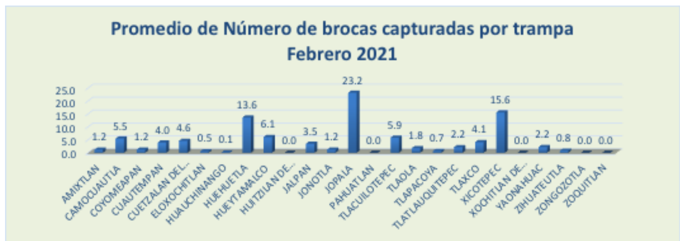
Figura 2. Promedio de número de Broca capturadas por trampa en los Municipio atendidos.